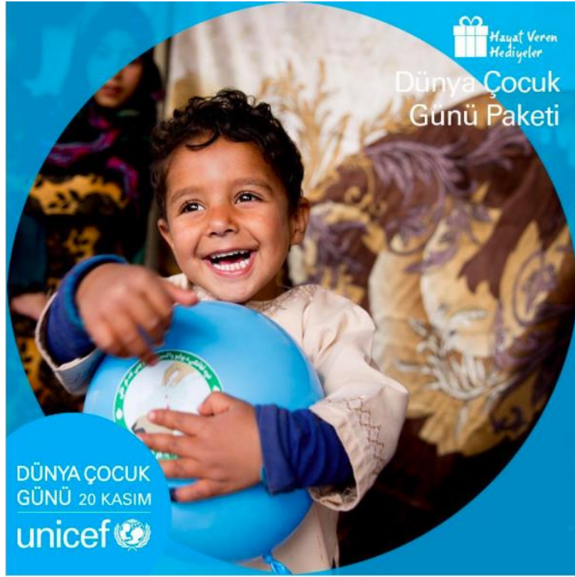
Şekil 3.8: UNICEF'in Instagram hesabında paylaşılan bir görsel