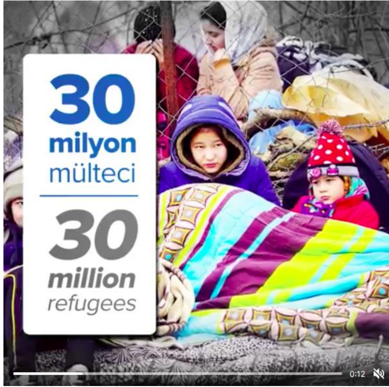
Şekil 3.22: SGDD-ASAM’ın Instagram hesabında paylaşılan bir videodan çocuk görseli