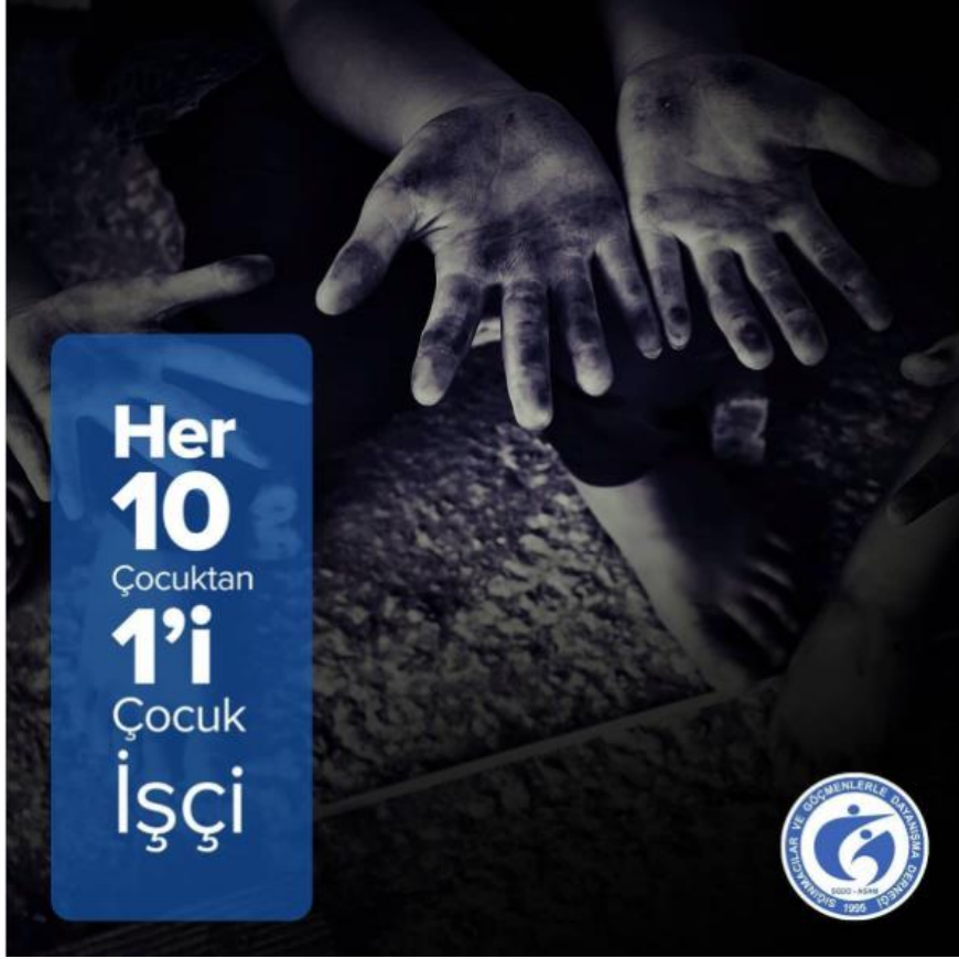
Şekil 3.3: SGDD-ASAM’ın Instagram hesabında paylaşılan bir görsel