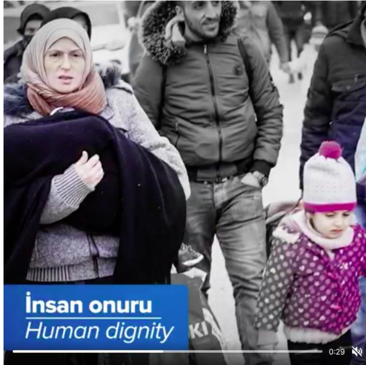
Şekil 3.25: SGDD-ASAM'ın Instagram hesabında paylaşılan bir videodan çocuk görseli