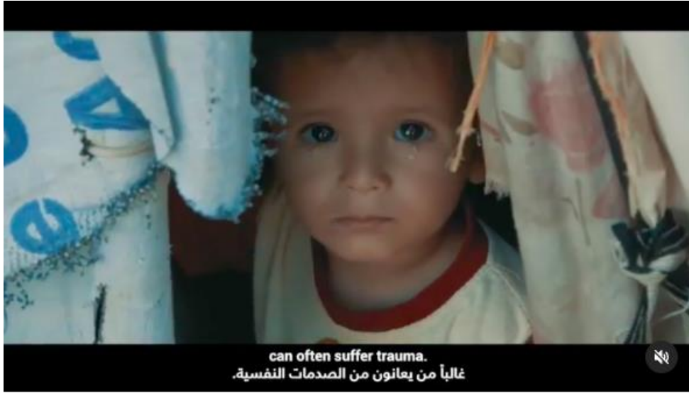
Şekil 3.15: Save the Children’ın Instagram hesabında paylaştığı bir videodan alınan görsel