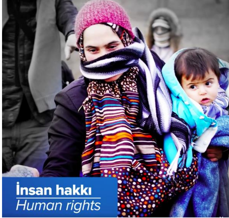
Şekil 3.26: SGDD-ASAM’ın Instagram hesabında paylaşılan bir videodan çocuk görseli