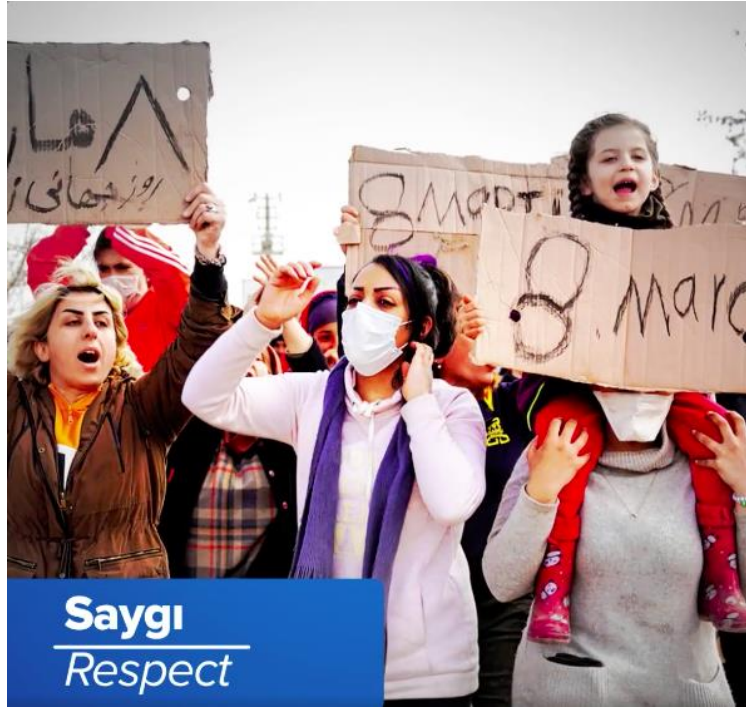
Şekil 3.27: SGDD-ASAM’ın Instagram hesabında paylaşılan bir videodan çocuk görseli