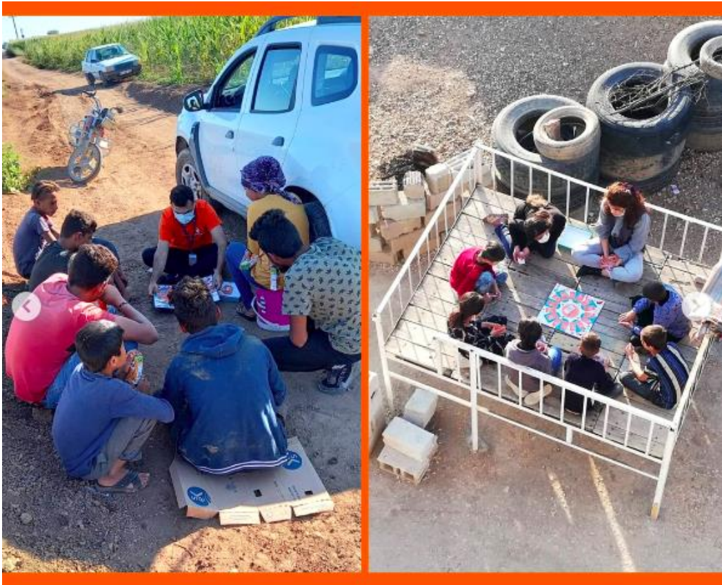
Şekil 3.18: Hayata Destek Derneği'nin Instagram hesabında paylaşılan bir görsel