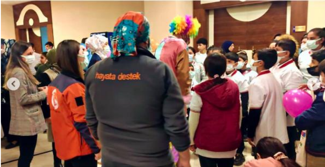
Şekil 3.20: Hayata Destek Derneği'nin Instagram hesabında paylaşılan bir görsel