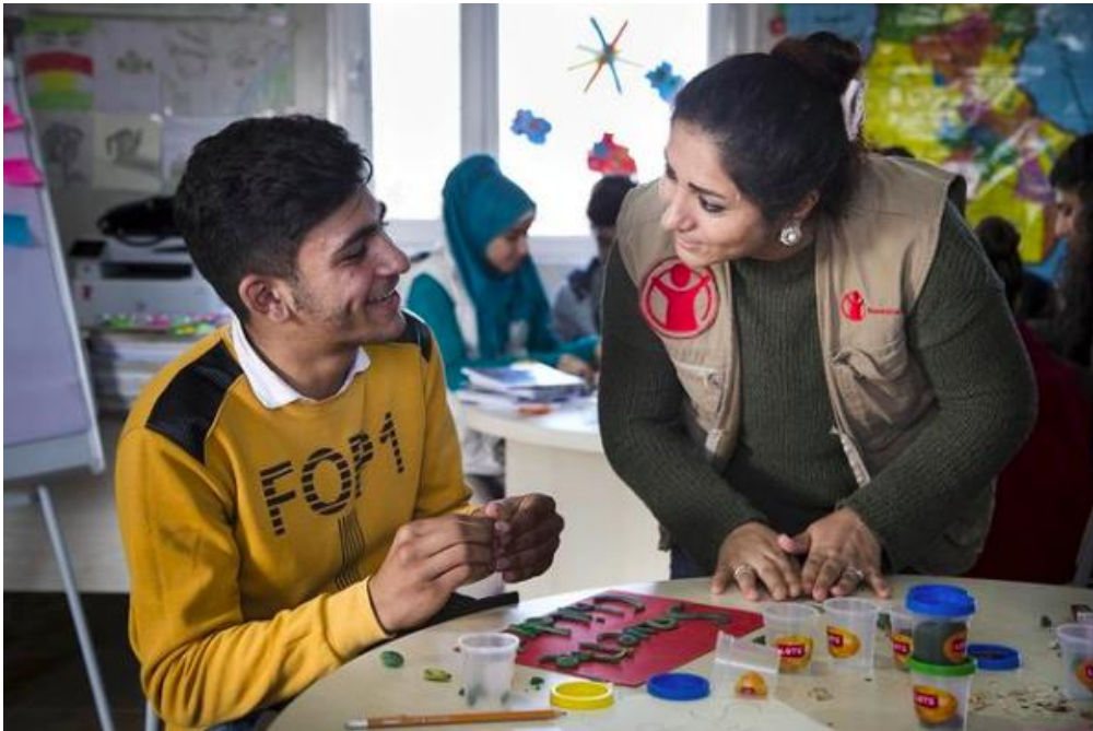
Şekil 3.21: Save the Children'in Instagram hesabında paylaşılan bir görsel