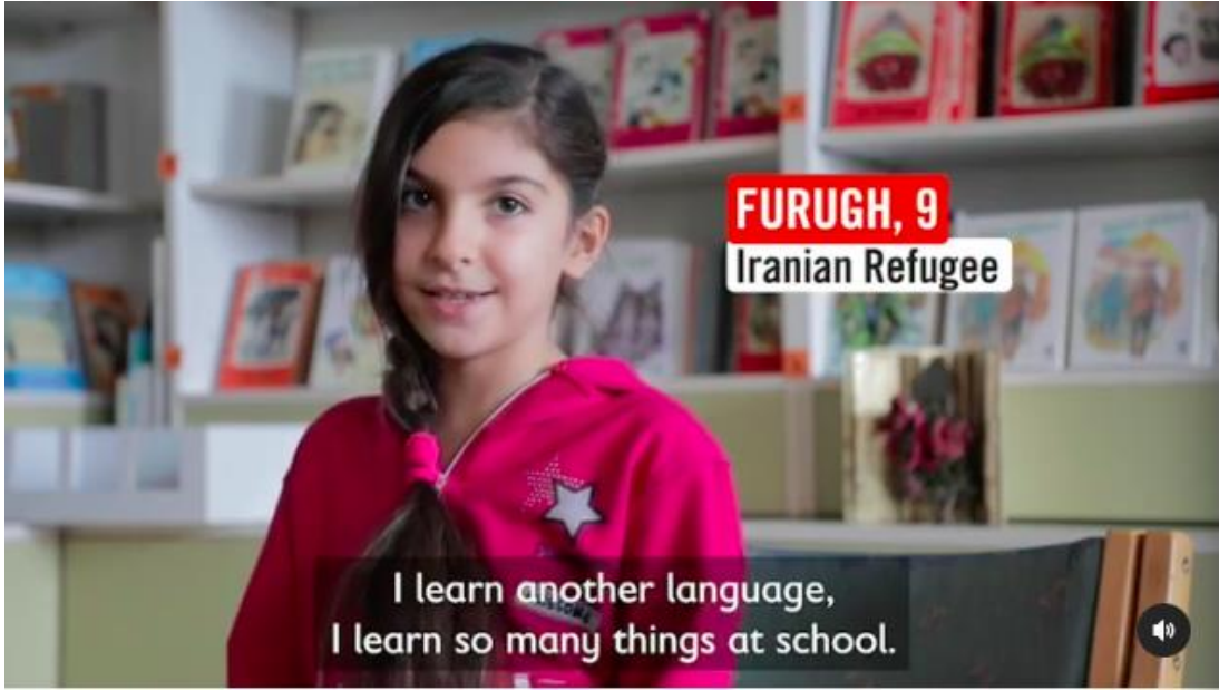
Şekil 3.9: Save the Children’ın Instagram hesabında paylaştığı bir videodan alınan görsel