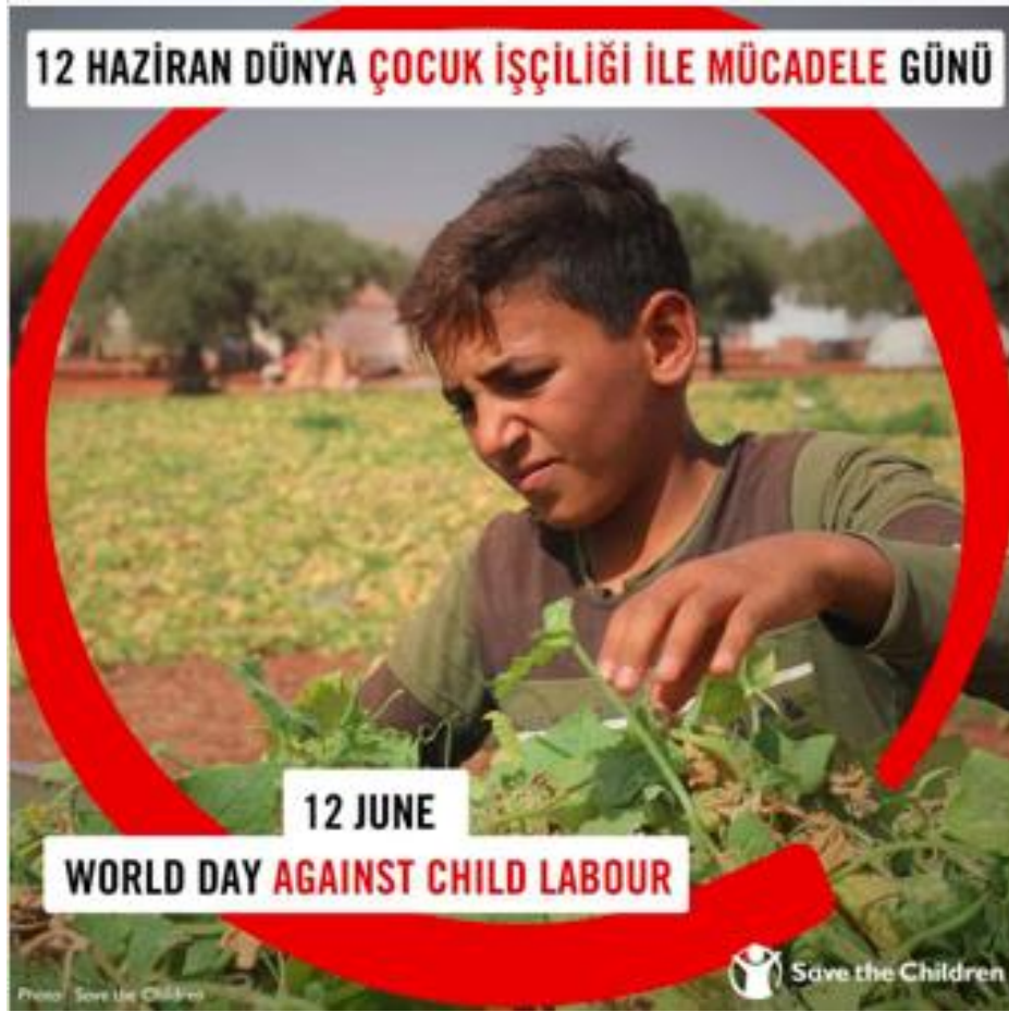
Şekil 3.2: Save the Children'in Instagram hesabında paylaşılan bir görsel