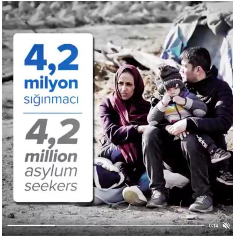
Şekil 3.23: SGDD-ASAM’ın Instagram hesabında paylaşılan bir videodan çocuk görseli