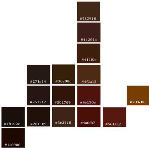
Şekil 6. Sentezlenen Fe-kil Nanopigmentlerinin RGB Değerleri ve Renk Kartelası

Düşük manyetik özelliklere sahip pigmentler, RGB Renk Şeması ve Onaltılık sayılara göre daha yüksek Chroma kahverengi renklerin elde edilebileceği görülmüştür. Demir oksit seviyeleri arttıkça ve renk kırmızımsı toprak tonundan koyu siyaha değiştikçe pigmentlerin rengi daha da derinleşmiştir, bu renk paleti Şekil 6'da görülebilir. En koyu siyah renk, manyetik özelliklerde olduğu gibi beklenen şekli ile kil katkısız saf demir oksit partiküllerinden elde edilmiştir. Renk paletinde sarı alt tonları sepiyolit kili ile elde edilirken, halloysit tipi killerde daha kırmızı alt tonlu renkler elde edilmiştir.