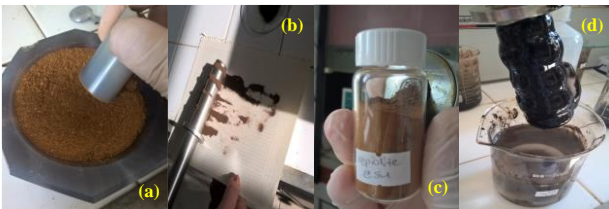
Şekil 4. (a) Pigmentin Öğütülmesi, (b) Mıknatıs Çubukla Manyetik Özelliklerinin Öğütme Sonrası Kontrol Edilmesi, (c) Kurutulmuş Pigment ve (d) Kurutma Öncesi Mıknatıs Çubuk Kullanılarak Demir Oksidin Çözeltiden Ayrılması

AMD ilaveli demir çözeltilerinden yaş ayırma işlemi ve demir oksit pigmentlerinin kurutma sonrası üretim aşamaları Şekil 4'de görülebilir. Sentezlenen demir oksit pigmentlerinde manyetik hassasiyet aranmıştır. Zira söz konusu manyetik pigmentle boyanmış kumaşlardan hazırlanan manyetik hassasiyeti yüksek yapılar, güvenlik, tekstil, sanat ve mimarlık endüstrilerinde birçok avantajla çalışılabilir. Bu pigmentlerle boyanan tekstiller, insanların her gün kullandığı elektrikli cihazlara kolayca dahil edilebilen yüksek teknoloji ürünü manyetik kumaşlar olarak işlev görebilir. Manyetik pigmentler, fotokopi ve lazer yazıcılarda toner pigmentleri olarak kullanılabilir ve banknotların yanı sıra tekstillerin basılması gibi özel baskılarda uygulama alanı bulabilir (Pfaff, 2017). Susuz baskı teknolojileri, tekstil boyamada giderek yaygınlaşan çevreci uygulama olarak eko-tekstillerde ve/veya tekstil endüstrisinde teşvik edilen uygulamaların başında gelmektedir.