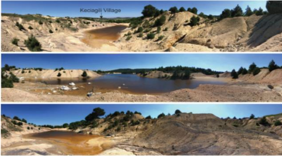
Şekil 2. Türkiye'de Kontamine Olmuş Bir Yapay Gölün Panoramik Çekimleri (Yucel ve Baba, 2016).

yapmaktadır. Bu küçük ve orta ölçekli madencilik faaliyetlerinden bazıları üretimi durdurmuş ve terk edilmiştir. Uygun rehabilitasyon olmadan bu alanlarda büyük delikler ve bozulmalar gelişmiştir ve oluşmuş asidik sızıntının sulara boşalması zamanla yüksek metal konsantrasyonları biriktirmiştir. Şekil 2' de ülkemizde bu şekilde bozulmuş su birikintisinin görüntüsü farklı açılardan verilmektedir (Yucel ve Baba, 2016). Bu birikintiler ve göletlerden alıcı ortamlara ulaşarak yüzey ve yeraltı sularını kirletebilecek ciddi bir kirlilik kaynağıdır.