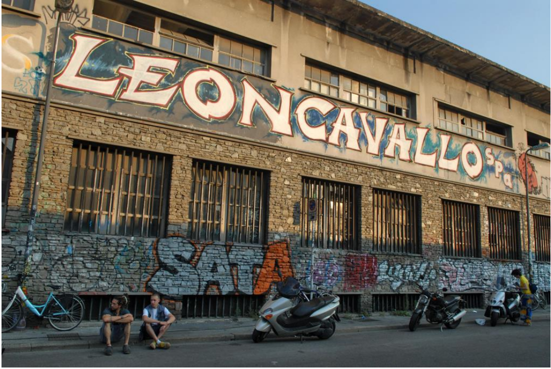
Resim 17: Leoncaravallo Sosyal Merkezi

Türkiye’de işgal evi geleneği siyasi anlamda yeni bir konu olarak ele alınmıyor. Özellikle 1970’li yılların politik açıdan çalkantılı ortamında, üniversite işgalleri veya Marksist sol geleneğin beraberinde getirdiği fabrika işgalleri mevcut olsa da, bir mülkün işgal edilip sosyal bir merkeze dönüştürülme pratiği, 2013 yılında gerçekleşen Gezi Direnişi sonrasında başlar. 2013 sonrasında oluşturulan işgal evleri Yel değirmeni Don Kışot, Kadıköy Caferaga, Söğütlüçeşme Samsa, Beşiktaş Berkin Elvan ve Acıbadem Lojman işgal evleri olarak sıralanabilir (Squat!net, 2018). Bunlar arasından Yeldeğirmeni Don Kışot işgal evi en çok ses getiren işgallerden biri olarak öne çıkar. Gezi Direnişi sonrasında İstanbul’un çeşitli merkezlerinde oluşturulan mahalle forumları, alternatif bir ortak düşünce ve karar verme mekânizması oluşturdu. Havanın sıcak olduğu yaz ayları boyunca parklarda ve kentin boşluklarında forumlar düzenleyen yerel kent sakinleri, kış ayları yaklaştıkça, toplantılarını devam ettirebilecekleri kamusal bir iç mekân arayışına girdiler. Bu sorunlar doğrultusunda bu fonksiyon için tasarlanmış bir kent mekânının olmadığını fark eden kullanıcılar, Kadıköy Yeldeğirmeninde boş kalmış bir binayı işgal etmeye karar verdiler (Odakdergisi, 2018).