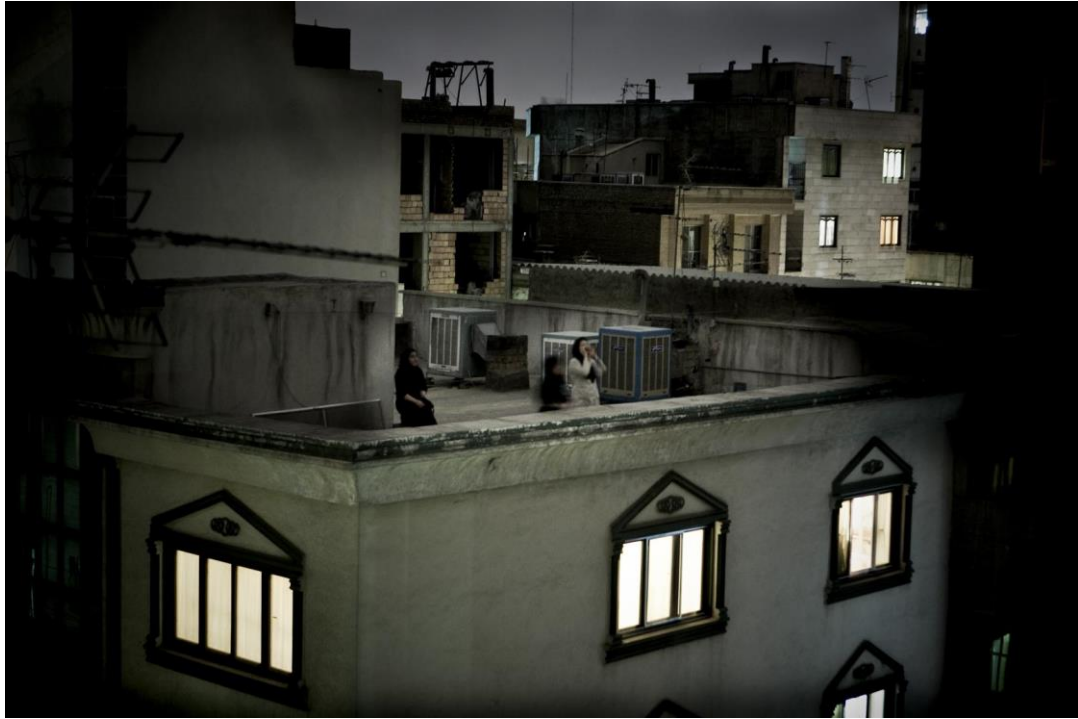
Resim 7: Pietro Masturzo'nun, 2009'da İran'da gerçekleşen protestolar sırasında çektiği fotoğraf

Artık mekânların yaratıcı potansiyeline dikkat çeken Pedram Dibazar, onu modern insan hayatının her yönünü tekeline almak isteyen düzenli mekân yapılarına karşı direniş olarak tanımlar (Dibazar, 2011). 2009'da İran'da gerçekleşen ayaklanmanın mekânsal pratiklerini inceleyen Dibazar, artık mekân olarak gördüğü çatıların eylemler sırasında nasıl bir önem taşıdığından bahseder. Öyle ki günlük hayatta kısıtlı –ya da kısıtlanmış- kullanıma sahip olan çatıların protestolarda nasıl işlev kazandığına vurgu yapar. Otoritenin baskıları sebebiyle politik kimliğinin tehlike altında olduğu sokak, protestocular tarafından zorlukla kullanılmış ve bu durum onları alternatif bir politik mekân yaratmaya sevk etmiştir. Sokakların yerine çatıları kullanan protestocular gece saatlerinde çatılardan slogan atmayı bir eylem biçimine dönüştürmüşlerdir. Başka bir coğrafyada tamamen farklı tanımlanabilecek olan çatılar, İran coğrafyasında isyanın mekânı olmuştur. Değişen mekân isyanın şeklini de değiştirmiş ve her ne kadar kolektif bir yapıya sahip olsa da, protesto için bireysel uygulama alanı yaratmıştır.