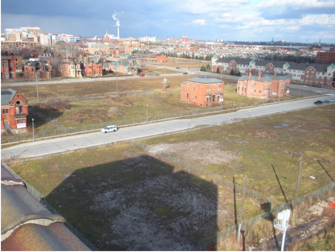
Resim 5: Brush Park-Detroit'in Boşlukları

Kentin eski ekonomik gücünü tekrar kazanamaması, oluşan artık mekânlar ile başa çıkılamamasına sebep olmuştur. Bu alanların yeniden kullanıma sokulamaması (tasarımsal anlamda) Detroit'e ölü kent görünümünü vermektedir. Başka örneklerden farklı olarak Detroit artık mekân oluşumunu masif bir şekilde yaşamıştır. Bu da onu istisnai bir yere koymaktadır. Günlük hayatta karşılaşılan artık mekânlardan ziyade Detroit'in artık mekânları, şehir coğrafyasının neredeyse ana unsuruna dönüşmüştür. Amerikan şehirlerinin yoğun kent yapısı, yerini boşluklara bırakmıştır. Tasarlanmamış olma durumu kendini hem yapılarda hem de boşluklarda göstermektedir. Kullanım atfedilmemiş boşluk ya da yapı mimar veya kullanıcı tarafından tanımlanmamıştır. Bu açıdan bu mekânlar, alternatif kullanımlara