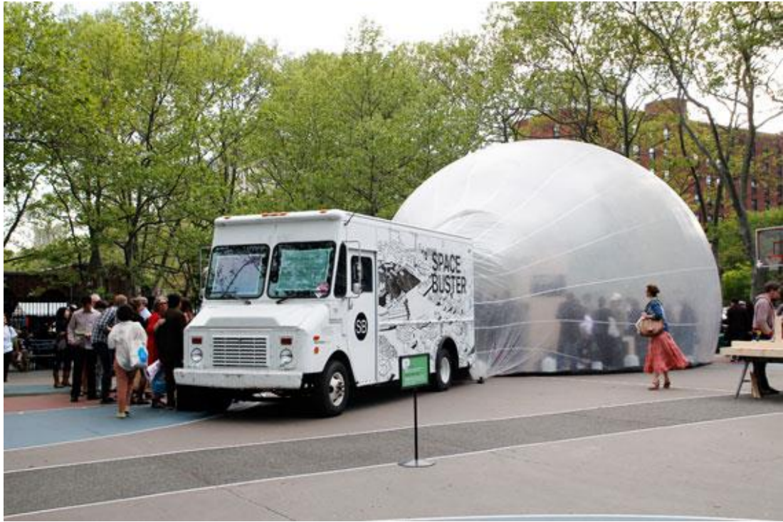
Resim 12:Space Buster Projesi

Geçici kullanım, bir önceki bölümde ele alındığı gibi kelimenin anlamına göre değişiklikler gösterse de, aslında mekân kullanım şekilleri üzerinde genel bir sınıflı tanımlar. Bu başlık altında değişen kullanım şekilleri ve farklı mekân yaklaşımları mevcuttur. Lehtovuori ve Ruoppila (2017) geçici kullanım tarz farklılıklarını tablodaki gibi sınıflandırmışlardır.