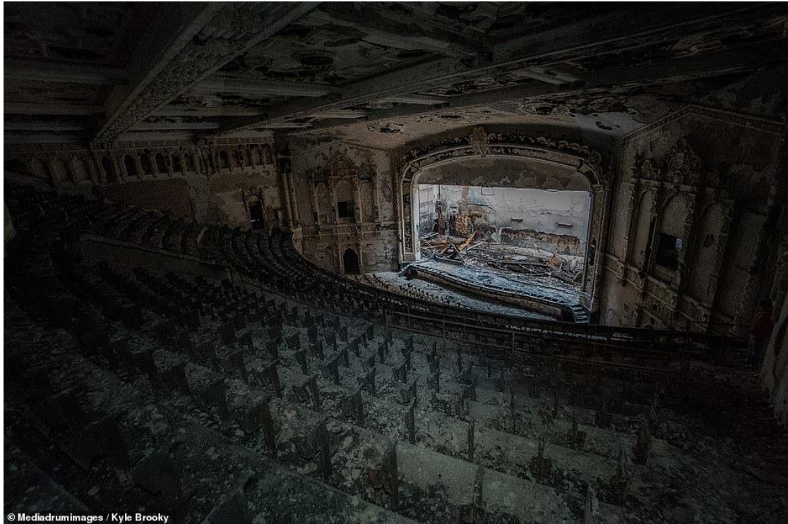
Resim 4: Cooley Lisesi Oditoryumu-Detroit

sağlamıştır (Bukowczyk, 1984). İlerleyen yıllarda, Amerikan otomobil endüstrisinin bölgede yoğunlaşması ile gelişmeye devam etmiştir. İkinci Dünya savaşına girilmeden önce bölge, üç büyüklere 11 ev sahipliği yapmaktadır ve Amerikan otomobil endüstrisinin en önemli merkezi konumundadır. 2. Dünya savaşında ise aynı bölge, savaş malzemesi imalatında önemli bir yer edinmiş ve ekonominin yanı sıra, Amerikan halkı için manevi bir değere de sahip olmuştur.