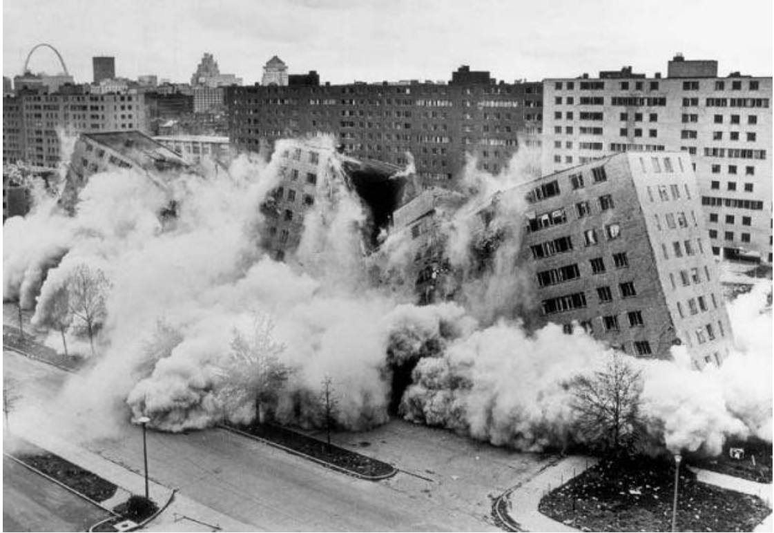
Resim 3: 1972- Pruitt İgoe Yıkımı

Rasyonel bir planlanmaya göre hayata geçirilmiş olup, büyük bir başarısızlık ile sonuçlanan bir diğer ikonik örnek ise Pruitt-İgoe toplu konut projesidir. Mekânın planlanan hali ile