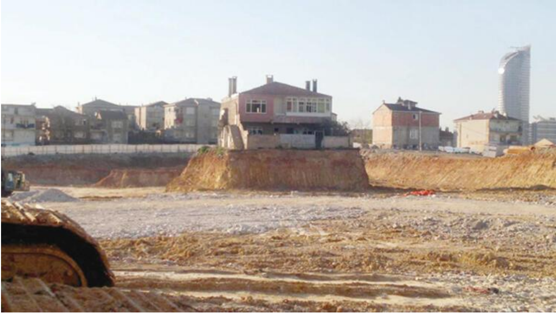
Resim 9:Fikirtepe İnatçısı

Ekonomik yollar ile yerinden etmenin izlerine, 2000 sonrası İstanbul'da gerçekleştirilen kentsel dönüşüm projelerinde rastlanabilir. 1999 depremi sonrasında yapı stoğunu