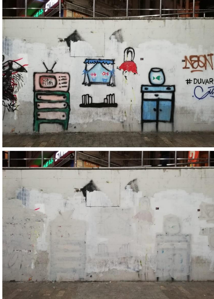
Resim 2: İstanbul/Karaköy'de bir altgeçit duvarı

Artık mekân tek sesli olabilecek bir kavram değildir çünkü artığın neye ve kime göre artık olduğu sorusu, artık mekân üzerinde bir belirsizlik yaratmaktadır. Bu yüzden bu ev artıktır ya da bu duvar artıktır gibi genelleştirici ve tanımlayıcı cümlelerden ziyade değişkenlik kavramı ön plana çıkar. Bu tez artık mekânı tanımlamaya çalışmaktan ziyade, mekânın değişkenliğini gösterebilmek için artık mekân kavramını kullanır. Atıl kalmış kent mekânları, değişebilen kullanım yöntemleri ile geniş bir örnekler bohçası oluştursa da artık olan atıl ile sınırlı kalmaz. Kimi zaman çanak antenler için uygun olan bir çatı, farklı bir kullanım oluşturması açısından artık olarak tanımlanır. Ancak bir çanak antenci için burası gayet kullanışlıdır. Ya da kent mekânına cephe veren bir duvar tek renkliliği bakımından artık olarak görülebilir ve farklı bir amaç ile kullanılabilir.