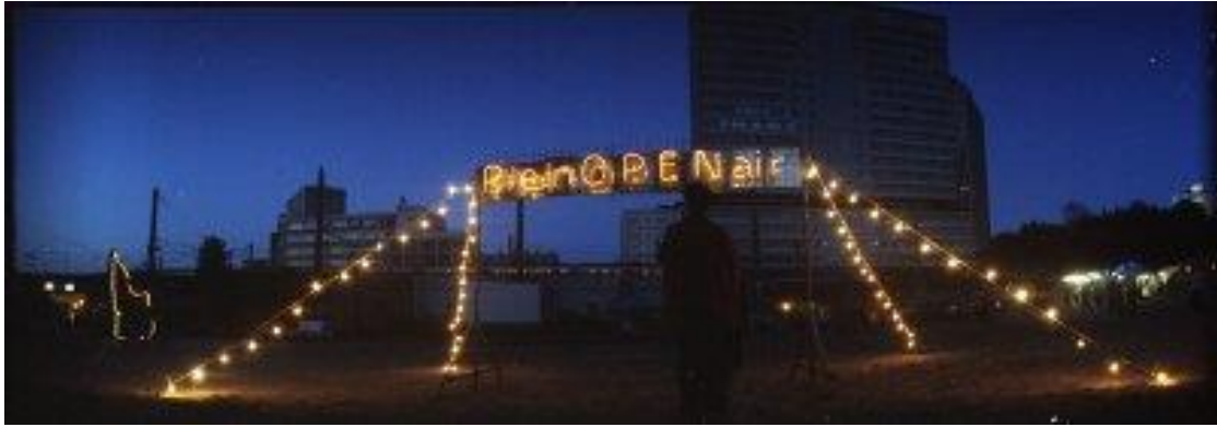
Resim 13: PleinOPENair

PleinOPENair, City Mine(d) ile Nova'nın (yerel bir alternatif sinema platformu) ortak yürüttüğü, şehrin açık alanlarında sinema gösterimleri yaptığı etkinliklerdir. Etkinliği özel kılan durum, gösterimler için seçilen mekânların, şehirde artık olarak kalmış, boş alanların ya da atıl yapıların seçilmesidir. Mekân seçiminin bu şekilde olması, herhangi bir finansal zorluğu devre dışı bırakmaktadır. Kiralanması gereken bir sinema salonuna ya da kapalı bir alana ihtiyaç duyulmaması gösterimlerin parasız izlenebilmesini sağladı. Bu sayede ekonomik etkilerin, etkinliğe erişimi engelleyecek unsurlarının üstesinden gelinmiş oldu ve şehir mekânının kullanılmasını sağladı.