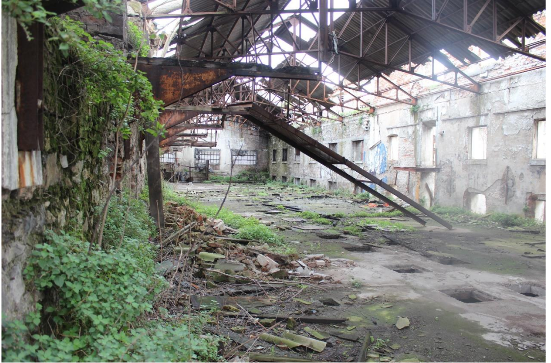
Resim 10: Kasımpařa Un Fabrikası

iktidar el deęiřtirir ya da feshedilir. Terk edilmiř alanların verdięi tekinsizlik hissi bu deęiřimin bir sebebidir ünkü alıřılmıř bir mekânda ve iktidarda deęilizdir. Burası gnlk hayatımızda kullandıęımız mekânlardan ayrılmıřtır ve bu yzden farklı hissettiriyordur. Algımızın kontrol deęiřir. Artık st el (iktidar) tarafından dzenlenmiř bir mutlak mekân yoktur. Algılarımız serbesttir ve hislerimiz yenidir. Edensor'un (2007) belirttięi gibi yoęun duysal deneyim, dzenlenmiř alana bir karřıtlık oluřturabilir. Hint pazarlarının dzensiz yapısını rnek veren yazar, bunun gibi alanların farklı duyuları pekiřtirebildiklerini vurgulamaktadır. Farklı mekânsal organizasyonların farklı řekilde algılanacaęına vurgu yapmaktadır. Ancak bu algılar dzenlenmiř mekânlarda baskı altına alınmıřlardır. Ktu kokulardan arındırılmıř řehrin belirli blgelerinde steril alanlar oluřturulurken, řehrin daha cra křelerinde kontrol altında olmayan kokularla ve yzeylerle karřılařmak daha olası olmaktadır. knt alanlarda deneyimlenen dokunsal duyu (bakımsız duvarlar, bilinmeyen cisimler vs.) řehrin geri kalanıyla tezat oluřturmaktadır (Edensor, 2007). Duysal olarak steril řehrin egemenlięini ve mutlak mekânını yıkmayı bařarabilen bir artık mekân, elbette ki bireysel zgrlk iinde bir sahne oluřturacaktır.