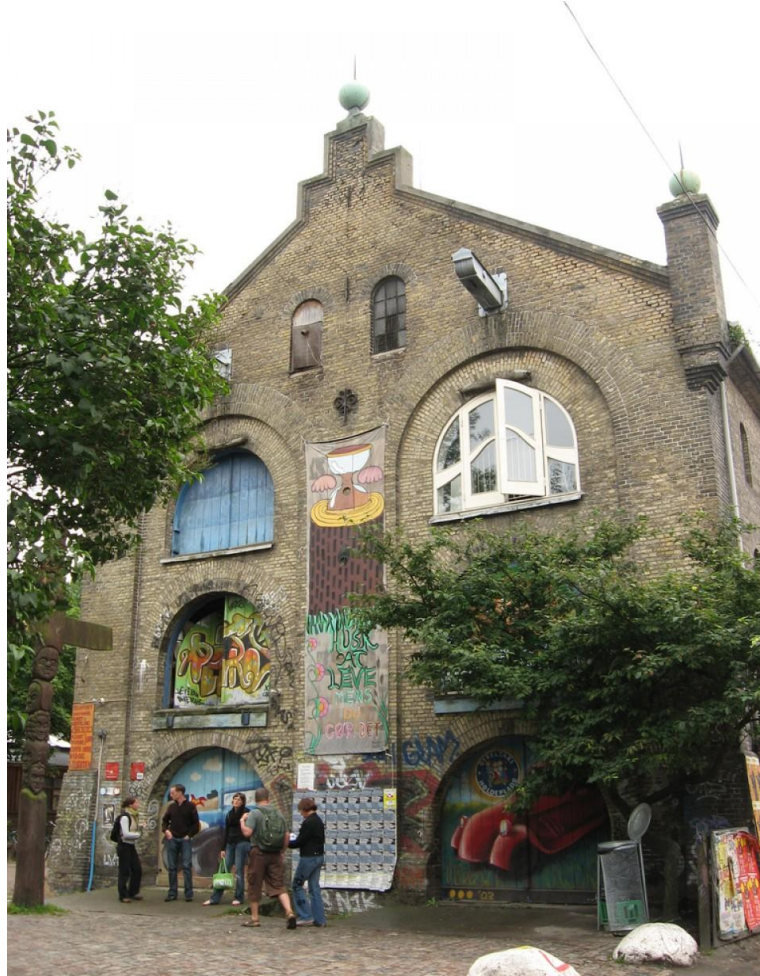
Resim 15: Cristiania Girişi

Bölge kuruluşunun özellikle ilk 10 yılı boyunca politik atmosferden fazlaca etkilendi. Ancak Christiania, tüm politik çekişmelere rağmen, 1972 yılında yarı-yasal bir statü edinmeyi başardı. Bu sayede bölge özerk bir statüye kavuşmuş oldu. Bölgenin özerk bir statüye kavuşması, sınırları dâhilinde gerçekleşen aktivitelerin, şehrin başka yerlerinde kontrol sahibi olan otoritelerden etkilenmemelerini –veya daha az etkilenmelerini- sağladı. Bu anlaşma ile illegal bir işgal olarak başlayan hareket, yasal bir zemine oturmaya başladı.