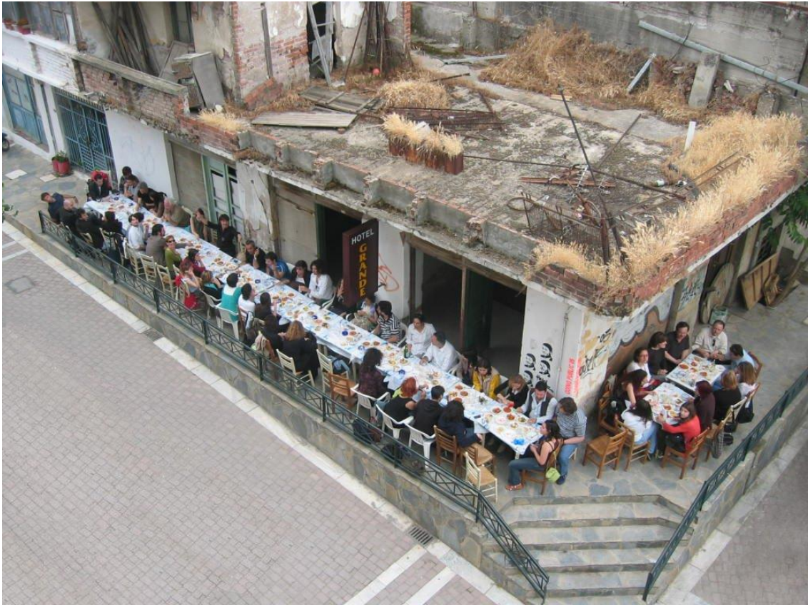
Resim 14: Hotel Grande-Atina

Hotel Grande, böyle bir yapı ve ortam içerisinde, atıl kalmış bir yapının kullanılmasıyla ortaya çıkar. Bölgede yaşayan etnik grupların yaşam tarzları göz önüne alınarak, mobilite ve geçicilik kavramları üzerine bir organizasyona dönüşmüştür. Hotel Grande, gerek ticari ilişkiler olsun, gerekse sahip oldukları yaşam tarzları yüzünden mobil bir hayat yaşayan bu