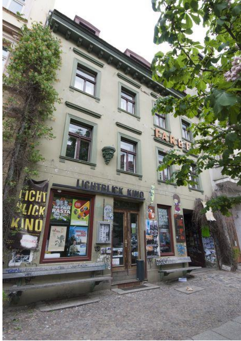
Resim 16:Kastanienallee 7 (K77) Binası

bekleyen yapı, doktor ve hemşire kıyafetleri giyen aktivistler tarafından işgal edilir. Aktivistlerin daha sonra iddia ettiği üzere, binanın işgali ‘tıbbi bir acil duruma’ verilen karşılıktı ve ‘evin kalbini kurtarmak, yaralarını sarmak ve onu hayatla doldurmak’ için yapılması gerekiyordu (Steen, Katzeff, Hoogenhuijze, 2016). Alman sanatçı Joseph Beuys’dan etkilenen grup, işgal eylemini sürekli performans ya da enstalasyon olarak gördü. İşgal eylemine illegal olarak başlayan grup 1994 yılında otoriteler ile anlaşmaya oturarak yasal bir hal aldı. İçerisinde çoğunlukla konaklama olmak üzere kâr amacı gütmeyen küçük bir sinema salonu, seramik atölyesi, stüdyo alanı ve bir homeopati kliniği bulunuyor.