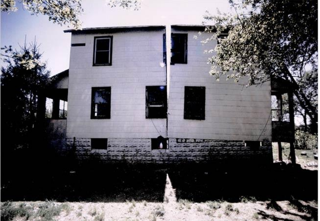
Resim 1: Splitting (1974)-Matta Clark