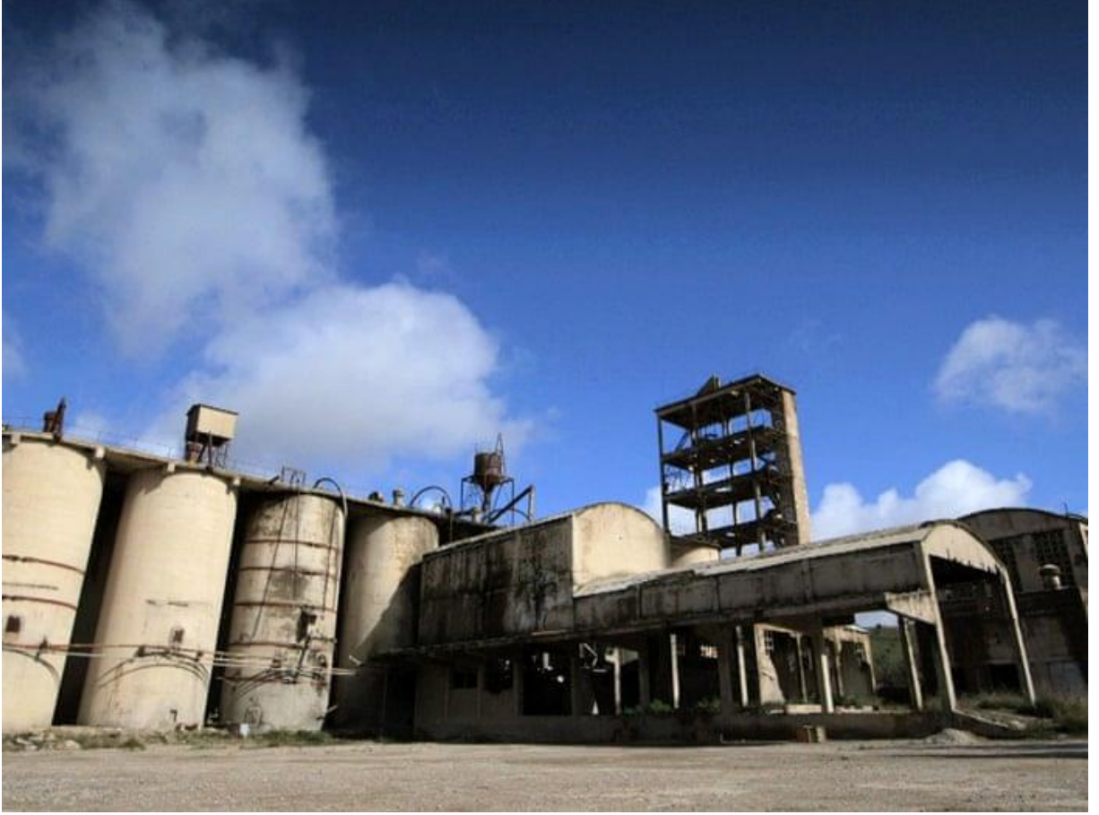
Resim 11: İspanya- Badajoz Terk Edilmiş Çimento Fabrikası