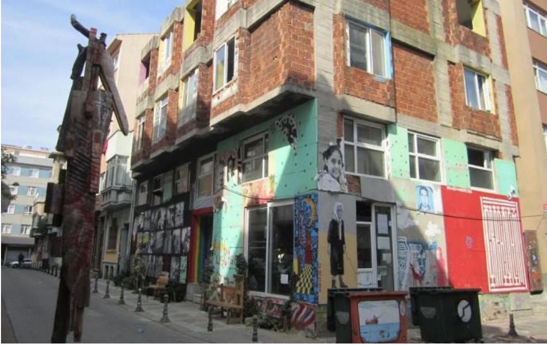
Resim 18: Don Kişot İşgal Evi

Aktif olduđu dönem boyunca işgal evi dâhilinde çeşitli forumlar düzenlenmeye devam etti. Bu forumlar yerel halk ile olduđu gibi, kentte bulunan uluslararası öğrenciler ile de enternasyonal bir ölçüğe çekildi. Forumlar haricinde atölyeler, film gösterimleri ve söyleşiler de, Don Kişot İşgal evinde yapılan etkinlikler arasında yer aldı. 2015 Kasım ayına kadar faaliyetlerine devam eden işgal evi, bu tarihten sonra yerel otorite baskıları ve polis baskınları sonucunda boşaltıldı.