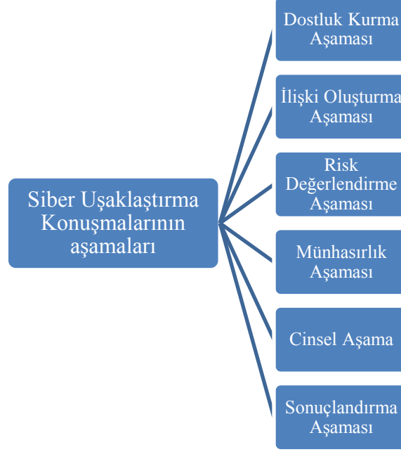
Tablo 3.3 : Siber Uşaklaştırma Konuşmalarının Aşamaları