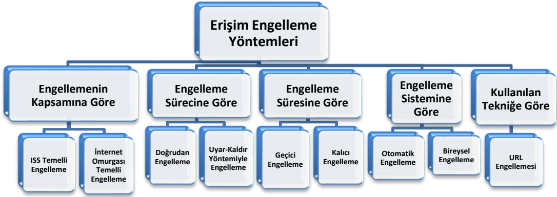
Tablo 2.1: Erişim Engelleme Yöntemleri

hukuka aykırı içeriğin engellenmesi amaçlanmaktadır 249 . Bu yöntemin en önemli avantajı hukuka aykırı içerik için web sitesinin tümüyle engellenmesinin önüne geçilmesidir 250 . Başka bir anlatımla erişim engellemenin orantılı şekilde uygulanmasını sağlamasıdır.