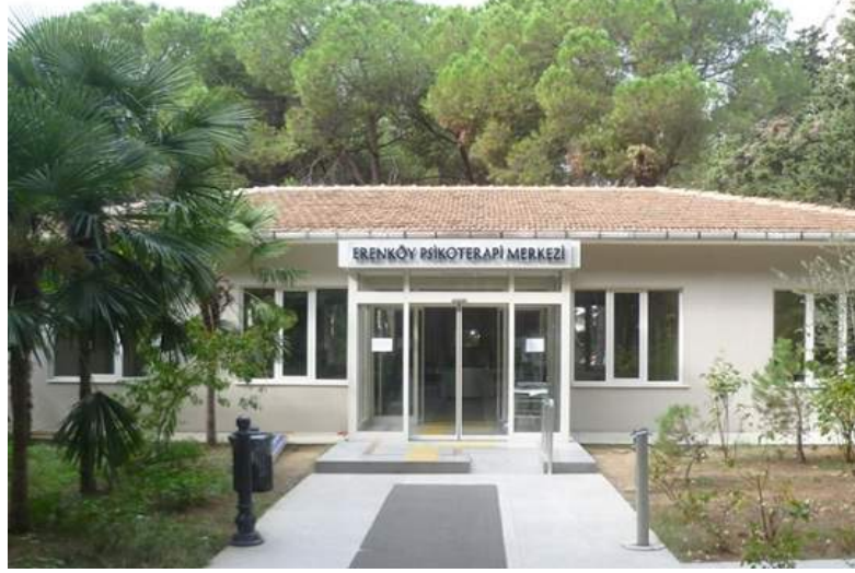
Fotoğraf 13: Tatko Binası bugün Psikoterapi Merkezi olarak hizmet vermektedir.

nedeniyle bu ek bina yapılamamıştır. 1967 yılında TATKO Anonim Şirketi, yapılamayan bu ek binanın inşası için İstanbul Verem Savaşı Derneği'ne 80.000 lira bağışta bulunmuştur. İlkokula birleştirilerek inşa edilen bu bina 1969 senesinde açılmıştır ve Tatko Binası adıyla anılmıştır. 163