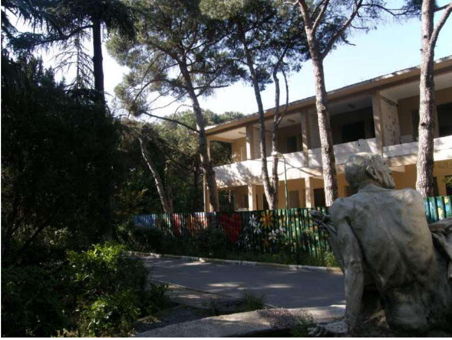
EK 9: Akbaytugan Pavyonu E-1 Kapalı Servisine dönüşümü, balkonlar kapatılıyor.