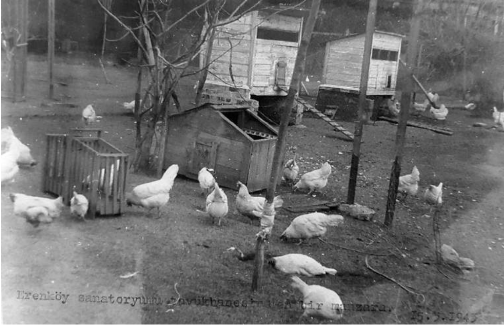
EK 10: 1943 yılında sanatoryumun tavukhanesi.