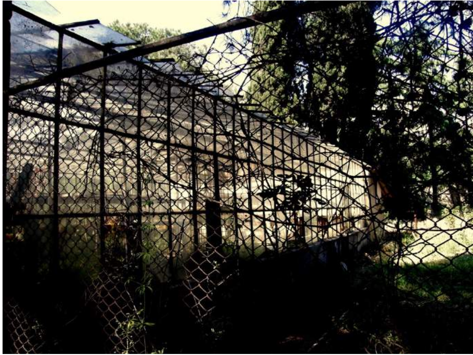
EK 8: Yerleşkenin Sanatoryum döneminden kalma serasına ait fotoğraf. Bugün yerinde bulunmamaktadır.