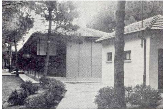
Fotoğraf 12: Çelik konstrüksiyon malzemeden inşa edilen Erenköy Aerium'u. 158

Çocukların kalacağı iki yatakhane, bir revir, bir hemşire yatak odası ve hemşire çalışma odasını barındıran 50 yataklı çelik konstrüksiyon bina, 27 Ağustos 1954 günü hizmete girmiştir. Yapımı için 73.000 lira harcanmış, aynı yılın Aralık ayına kadar toplam iki dönemde 76 çocuk tesiste tedavi görmüş ve bu süreçte 19.144 lira daha masraf yapılmıştır. Binanın eksiklerini giderebilmek ve çocukların kış aylarında da kalabilmelerine olanak sağlayabilmek için gerekli olan altyapının hazırlanabilmesi amacıyla yardım pulu hazırlanıp satışa sunulmuştur. Yardım pullarının satışından elde edilen gelire ikinci bir ek prefabrik bina yapımına başlanmıştır.