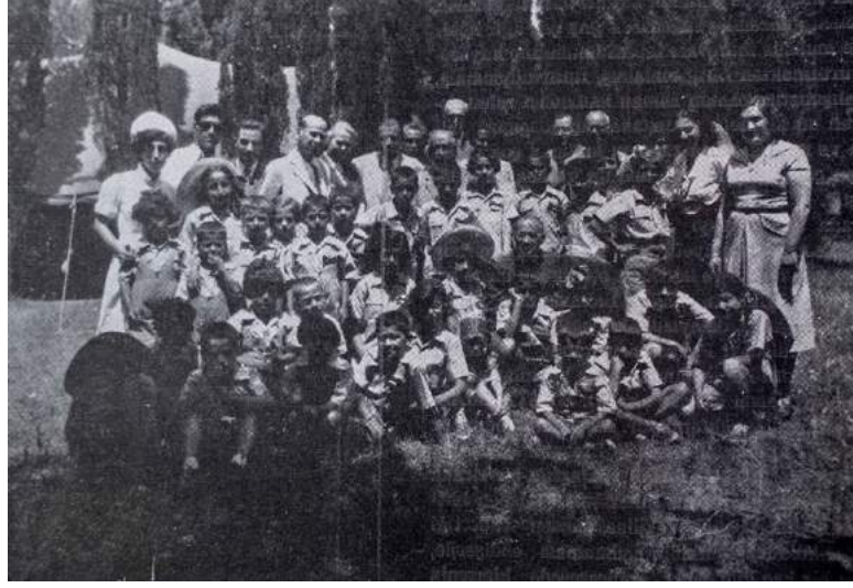
Fotoğraf 11: Çocuklar, yöneticiler, doktorlar ve hemşireler kampta birarada. 155

açılmıştır. 153 2 ay sürecek olan kamp, ilkokul yaşındaki çocukları yaz aylarında hastalığın bulaştığı evden uzaklaşmasını sağlayarak, iyi bir ortamda iyi beslenmelerini ve dirençlerini artırmalarını hedeflemektedir. 154