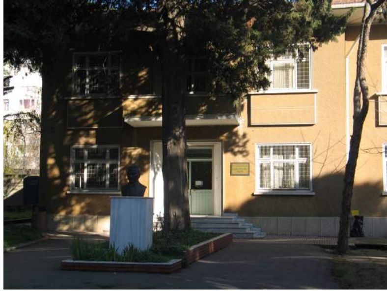
Fotoğraf 10: 1951 yılında tamamlanan Tevfik Sağlam Hemşire Okulu binası.