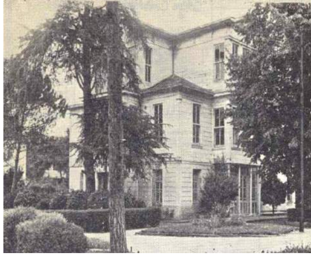
Fotoğraf 2: Sanatoryumun kurulduğu ısınma sorunu olan ahşap köşk. 82

Bu sorunun çözümü için gerekli olan kalorifer tesisatının getirdiği ek maliyeti karşılayabilmek için tekrar Kızılay'dan bağış yoluyla yardım alınmıştır. Kalorifer tesisatının bağışlanması, önemli bir açığı kapatmakla birlikte tesisatın döşenmesi için gereken meblağın karşılanabilmesi için bu defa halktan bağış toplama arayışı gündeme gelmiştir. 83