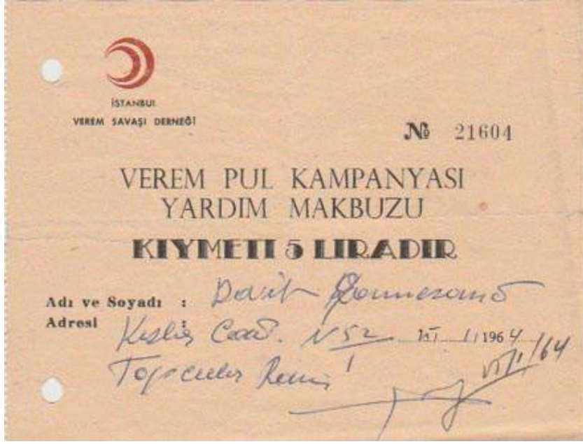
EK 6: 1964 yılında pul kampanyalarının devam ettiğini görmekteyiz. İhsan Olgu Demir kişisel arşivinden, 2019.