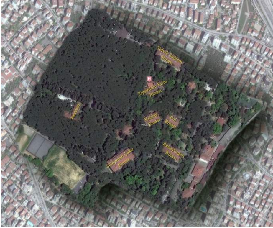
Fotoğraf 15: Erenköy Sağlık Yerleşkesi Anıtsal Binalarının İsimleriyle. 179

4 Şubat 1976 günü, İstanbul Verem Savaşı Derneği ve Sosyal Sigortalar Kurumu yetkilileri bir araya gelip devir sözleşmesi ve protokolünü imzalamıştır. İki kurum arasında yapılan bu protokole göre; İstanbul Kozyatağı'nda bulunan 98.260 metrekare arsa içerisindeki sanatoryum tüm tesisleriyle beraber, 100.000.000 lira karşılığında Sosyal Sigortalar Kurumuna devredilmiştir. Dernek, Sanatoryumda çalışan personeline geçmişteki borçlarını ve toplu iş sözleşmesinden doğan haklarını ödemeyi kabul etmiş, devredilmeden önce işlerine son verilene buradan doğan kıdem tazminatlarının ödenmesini de üstlenmiştir. Protokolün belki de en önemli maddesi, yıllarca veremle mücadele için yaptıkları bağışların anısını yaşatacak olan binaların isimleri konusunda olmuştur. Tesislerdeki binaların isimlerinin muhafaza edilmesi protokolle dernek ile kurum arasında karara bağlanmıştır. 180