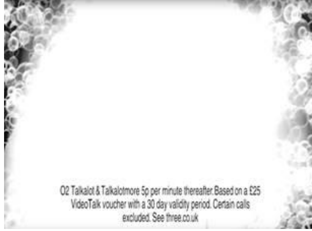
Şekil 3.4: Hutchison Reklam

Kaynak: https://www.youtube.com/watch?v=U_XFVYrQbZg