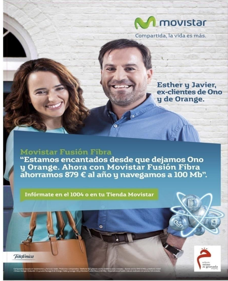
Şekil 3.2: Movistar Reklamı