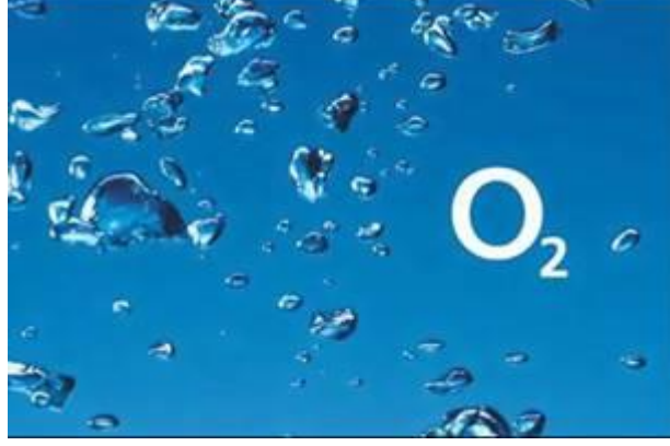
Şekil 3.3: O2 Reklamı