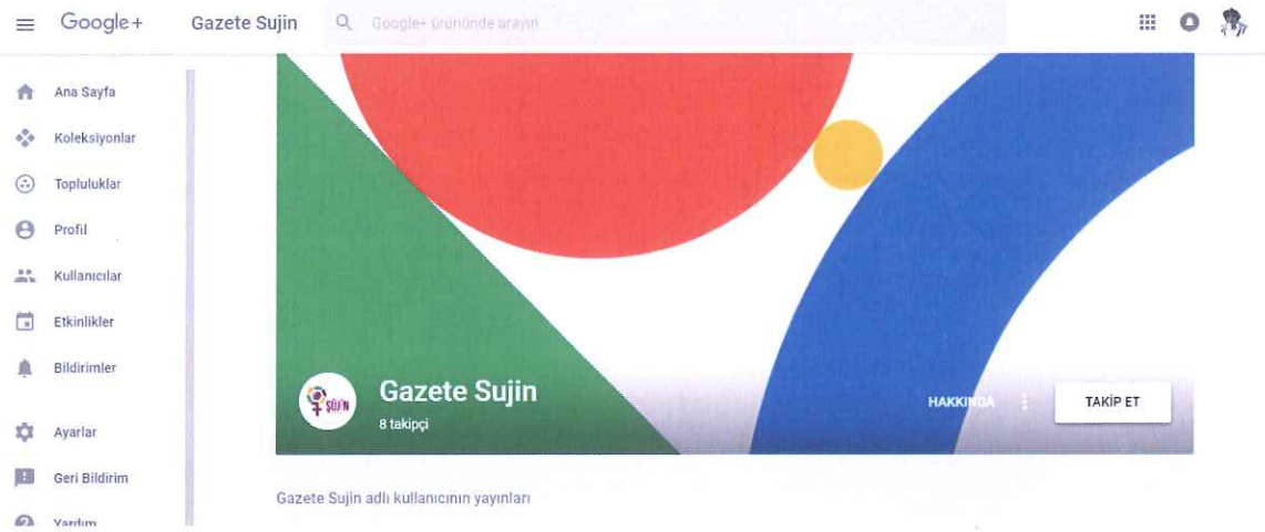
Şekil 7: Gazete Şujin Google+ Sayfası (Erişim Tarihi: 10.08.2017)

8 takipçisi var ve henüz hiç gönderisi bulunmamaktadır.