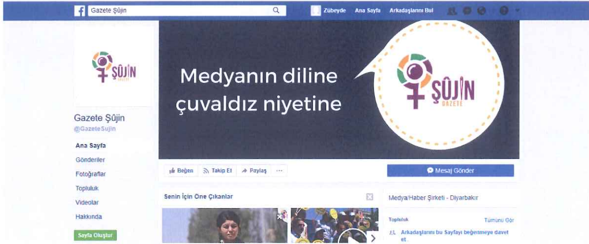
Şekil 3: Gazete Şujin Facebook Sayfası (Erişim Tarihi: 10.08.2017)