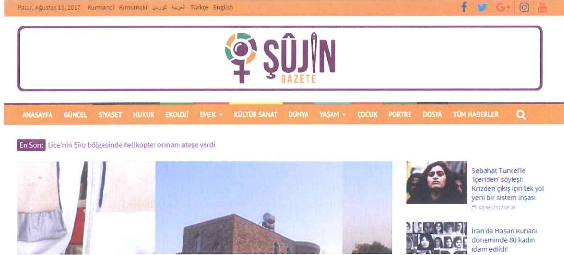
Şekil 2: Gazete Şujin web Sayfası (Erişim Tarihi: 10.08.2017)

Sitede yer alan başlıklar ve bölümler kadın ve dayanışma odağında oluşturulmuştur. Çok fazla içerik üretiminin, haberin yapıldığı bu mecra, internet sitesinden ziyade haber ajansı niteliğinde faaliyet göstermektedir.