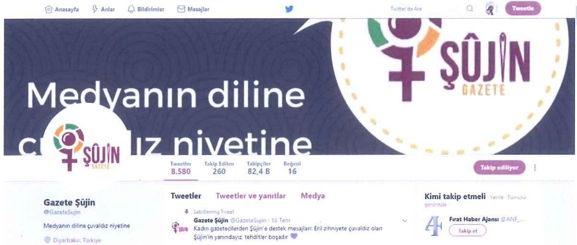
Şekil 4: Gazete Şûjin Twitter Sayfası (Erişim Tarihi: 10.08.2017)