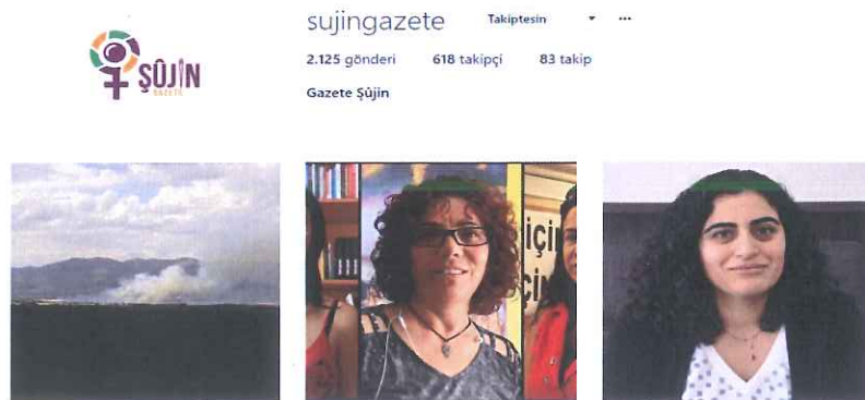
Şekil 5: Gazete Şûjin Instagram Sayfası (Erişim Tarihi: 10.08.2017)

Bu kanalda tüm haberlere yer verilmiyor. Yoğunlukla gönderinin yapıldığı konular; portre, politika, emek'tir. Portreler bahsedildiği gibi dünyadan ve yerelden farklı kadınları konu etmektedir. Ayrıca portrelerde dikkat çeken nokta, kadın fotoğrafları yakından çekilerek portre boyutuyla verilmekte, yaygın haberlerden farklı olarak kadın bedeni teşhiri yapılmamaktadır.