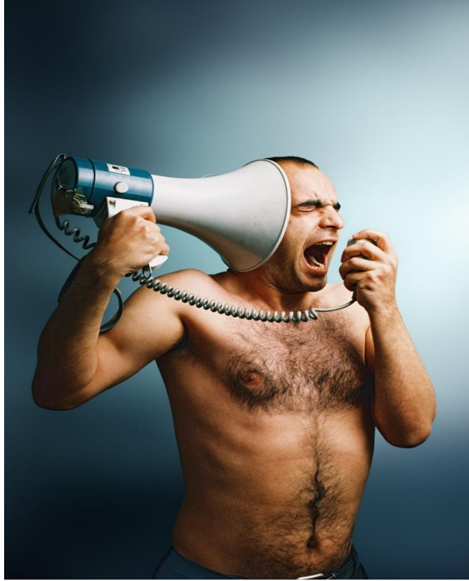
Görsel 5: Şener Özmen, Untitled/Megafon , 2006.

kötü muamelenin yapılabileceği) arasındaki (eşikteki) durumunu “temsil” eden bir imgeye dönüşmektedir. Sanatçının çıplaklığı (giyinik olmayışı) elbette ki gerçek bir çıplaklık değildir. Bütün örtük anlamların açığa çıkarıldığı bir durumdur ve böylesi bir çıplaklık durumu ise en nihayetinde Homo Sacer topluluğunun murdar, kutsal ve bu sebeple de öldürülebilir “doğasına” işaret etmektedir. 99