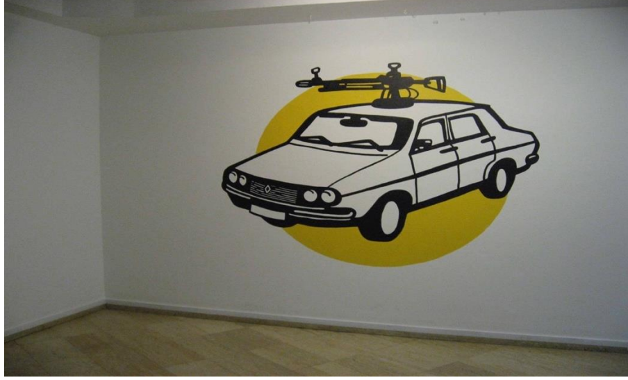
Görsel 19: Ahmet Öğüt, Untitled/İsimsiz, 2007.

çalışmasına benzer bir şekilde Öğüt çalışmasında Beyaz Toros görüntüsüne bir ilave yaparak ona bir müdahalede bulunabilmeyi amaçlamaktadır. Üzerinde ağır bir silahla resmedilen Beyaz Toros böylelikle kolektif hafızada devlet şiddetiyle özdeşleşen anlamına, basit bir araba olmanın ötesinde bir “ölüm makinasını” temsil eden anlamına (görünümüne) ulaşmaktadır.