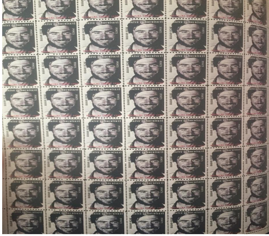
Görsel 8: Halil Altındere, Kayıplar Ülkesine Hoş geldiniz , 1998.

arasında yaşanan takas Altındere'nin çalışmasında nesneye yapılan müdahale ile anlamda yaşanan değişim sayesinde mümkün olurken her iki sanatçı da bu sayede bambaşka bir ilişkisel durum yaratabilmenin imkanını sorgulamaktadır.