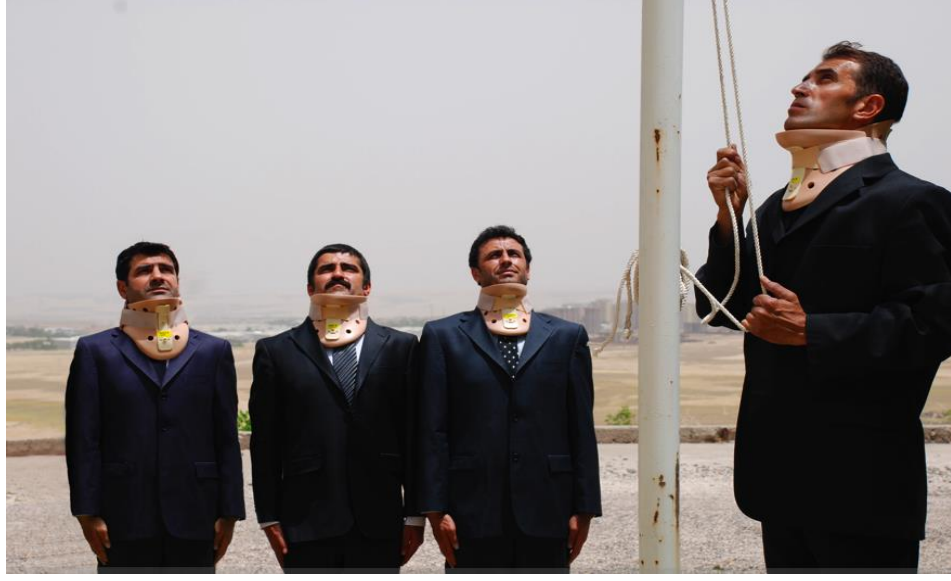
Görsel 12: Şener Özmen, Flag/Bayrak, 2010.

Öte yandan Özmen, bir jimnastikçinin elinde bavulu ile çıktığı göç yolunda görüleceği On The Road/Yolda adlı fotoğraf çalışmasında da benzer bir şekilde iktidarın beden üzerinde yoğunlaşan biyopolitikasına gönderme yaparken bu kez yaşamın hedef alındığı diğer veçheleri de gündeme getirebilmeyi amaçlamaktadır. Özmen’in bu çalışmasını 90’lı yıllar Kürt alanında yaşanan köy yakımları sonrası yerinden edilme, zorunlu göçle ilişkili okumak mümkün olduğu gibi bunun yanı sıra güncel mülteci, göçmen meselesi bağlamında da okuyabilmek mümkün olmaktadır. Bu fotoğraf çalışması, disipline edilen bedenin belki de en iyi örneğini sunan bir jimnastikçinin çıktığı göç yolunun güçlüğüne hazırlıklı bedeni görünür kılarken beden ve yaşamın iktidar tarafından nasıl düzenlendiğini sorgulayan güçlü bir sahne sunmaktır. Foucault’nun tanımlayacağı iktidar teknolojilerinden ikincisi olan düzenleştirici teknoloji, Foucault’ya göre bedeni hedef alan disiplinci teknolojiden farklı olarak insan yaşamını (nüfusu) hedef almaktadır. 128 Disiplinci teknolojiler ile “bireysel terbiye” amaçlanırken düzenleştirici teknolojide ise bu kez “bütünün güvenliği” amaçlanmaktadır. 129 Düzenleştirici yaşam teknolojileri