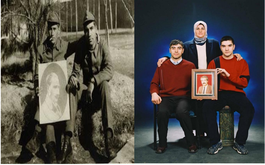
Görsel 6 ve 7: Cengiz Tekin, Fotoğraf, 2005.

resmi tarihin anma siyasetinin en büyük temsili olan Atatürk fotoğrafı son fotoğrafta yerini bu kez zorla kaybettirilenlerin “temsili” (ve ortak temsil haline gelmiş) fotoğrafına bırakmaktadır.