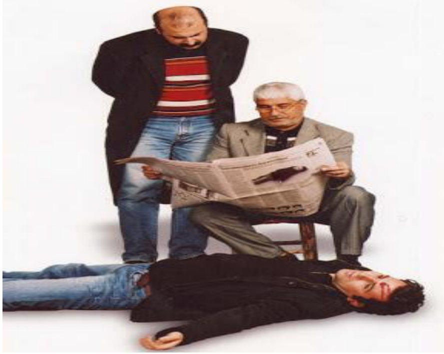
Görsel 10: Cengiz Tekin, Untitled/Press (Basın), 2007.

Cengiz Tekin, sanat tarihi içerisinde bir tür resim yapma tekniği, üslubu olan natürmortlara gönderme yaparak yeni anlam olanakları yaratabilmeyi amaçlayacağı Natürmort (2007) adlı fotoğraf çalışmasında ise Kürt alanına bambaşka bir “perspektifle” bakabilmenin imkanını arayacak ve çerçevenme, belli bir bakışa-perspektife indirgenme, temsil tartışmalarını bu kez estetik boyutu ile birlikte gündeme getirmeye çalışmaktadır. Natürmortlar bilindiği üzere hareketsiz nesnelerin; doğasından koparılmış, cansız varlıkların resmedilmesine verilen isim olmakla birlikte ölü veya cansız doğa anlamlarına gelmektedir. Sanatçının çalışmasında ise yaratılan “kompozisyonda” bu kez kırsal ve kimsesiz gibi görülen seyirlik bir arazide yüzükoyun yatan bir “ölü beden” (faili meçhul bir cinayet olduğu anlaşılan) tasvirine yer verilmektedir. Sanatçının çalışmasında bir tür “dil oyunu” yaratarak gönderme yapacağı ölü doğa (natürmort) ise esasen yarattığı çağrışımla cansız bedenlerin kimsesiz arazilerde bulunulduğu Kürt alanının 90’lı yıllardaki faili meçhul cinayetlerinin hafızada yer edinen görünürlüğüyle (imgesiyle) örtüşmektedir. Dolayısıyla yerde yatan “ölü beden”, ceset bu kez