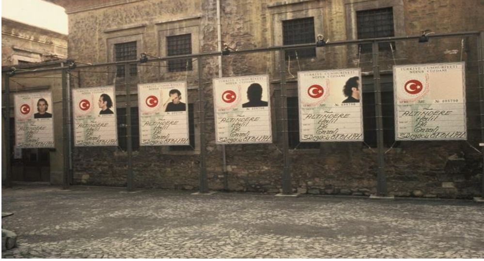
Görsel 17: Halil Altındere, Tabularla Dans , 1997.

sebebiyle çekilen fotoğrafları hatırlatırken sanatçı, kimliğinin beraberinde getirdiği “suçluluğa” gönderme yapmaktadır. İktidar tarafından atfedilecek olan “suç unsuru” ya da belirlenecek “suçlu” giderek daha muğlak bir kategoriye ifade ederken; tehdit unsuru olarak görülen toplumun belli bir kesimine kolaylıkla yüklenebilecek ve böylelikle bu grubun hedef haline getirilebilmesinin de önünü açmaktadır. Bir “güvenlik sorunu” olarak görülecek olan suçlunun yaşamı artık hayat ile hukuk arasındaki belirsizlikte neşet edecek olması sebebiyle de iktidar tarafından denetim altına alınmaktadır.